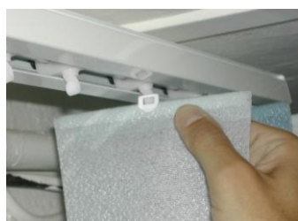
3. Accrocher les lames