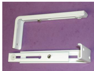
Equerres pour une pose murale