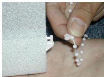
4. Fixation des clips de la chaînette