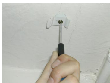
1. Visser les Clips porteurs