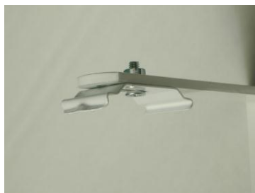
1. Visser le clip porteur sur l'équerre