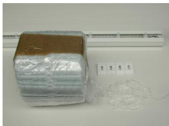
Jeux de bandes + Rail + Clips + Chaînette