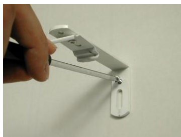
1 bis. Placer les équerres au mur

Le nombre de supports est prévu pour une utilisation normale du store.