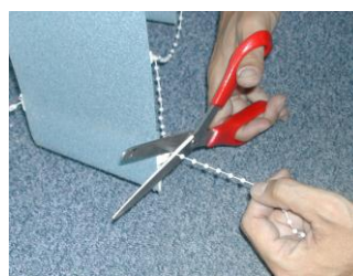
5. Couper la chaînette

Avant d'accrocher vos bandes, positionnez les crochets des chariots perpendiculairement au rail.