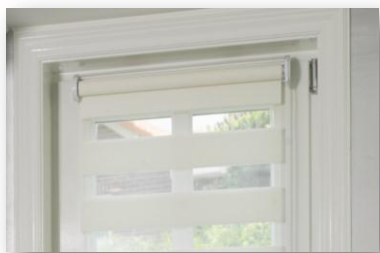
Extérieur visible (bandes Superposées)

Enroulement avec dédoublement du tissu qui va permettre de jouer avec la lumière aussi bien lors de la descente que de la montée du store, manœuvre par mécanisme à chaînette blanche.