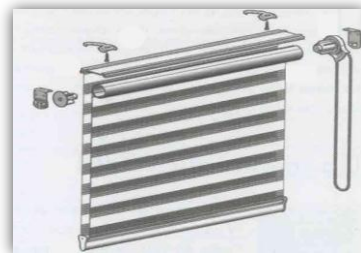
occultation de la vue (bandes décalées)

Dans ce cas on aura un store Enrouleur qui donnera la possibilité de moduler la luminosité par la translation des bandes progressivement, jusqu'à quasiment l'occulter :